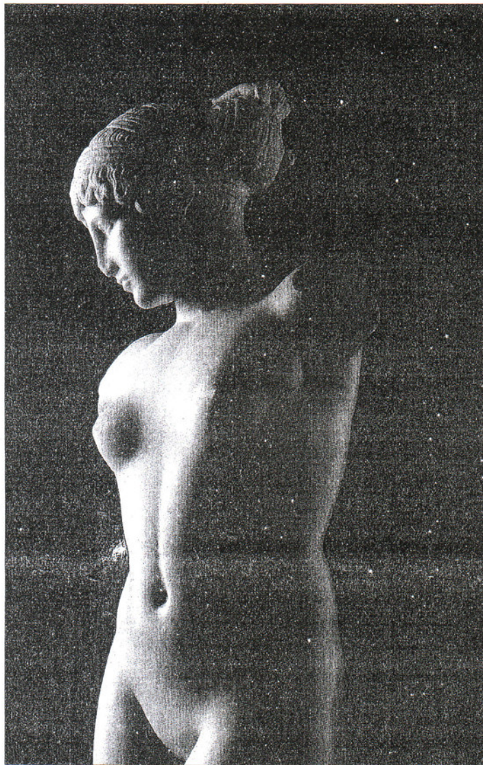
La statue découverte sur l'Esquilin en 1874 et qui a maintenant un nom.