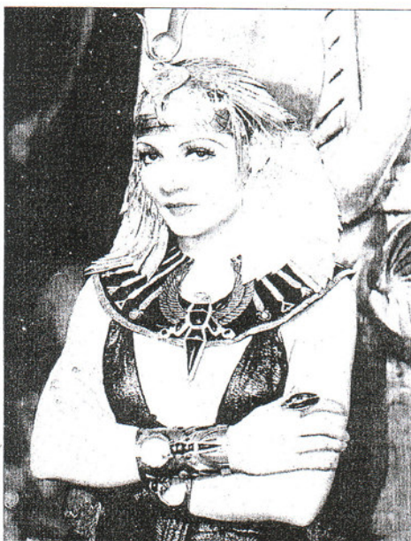
Claudette Colbert dans le film de Cecil B. de Mille (1934).