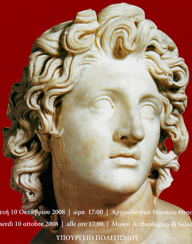
Tavola Rotonda Alessandro Magno: incontro con un mito

Παρασκευή 10 Οκτωβρίου 2008 | ώρα 17:00 | Αρχαιολογικό Μουσείο Θεσσαλονίκης Venerdì 10 ottobre 2008 | alle ore 17:00 | Museo Archeologico di Salonicco